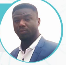
مادة التاريخ أ/ الفرزدق السماني